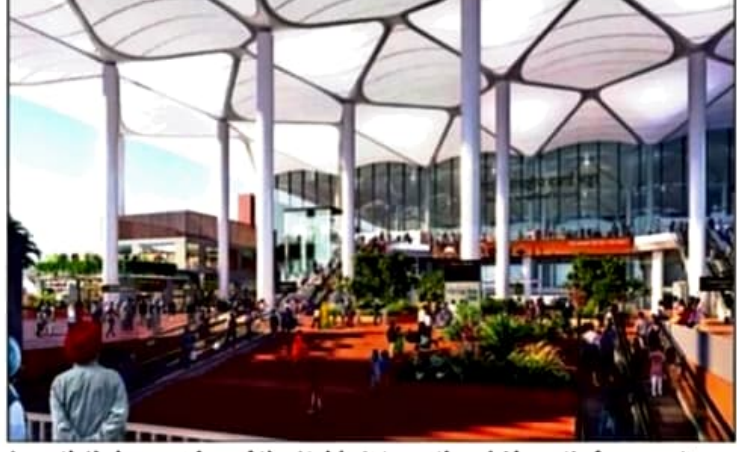
An artist's impression of the Noida International Airport's forecourt

NIA will be one of the most advanced airports of India in terms of using technology. We are considering using digital technology at immigration counters and are in conversa-